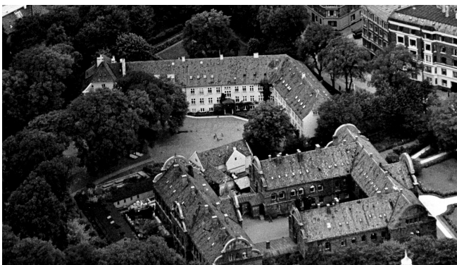
Luftfoto af skolen efter de første hundrede år. Til venstre i billedet ses De Døckerske Barakker og i midten gymnastikhuset fra 1859.

Hidtil havde Institutet på Kastelsvej været enerådende på undervisningsområdet, men fik nu konkurrence fra Johan Kellers Døvstummeskole, grundet på Talemotoden, (1856) og af Det kgl. Døvstummeinstitut i Fredericia, (1881). Men det kniber fortsat med pladsen, og igen overvejer man både udvidelse og udflytning, blandt andet til Hellerup, Bryggervangen eller Gentofte.