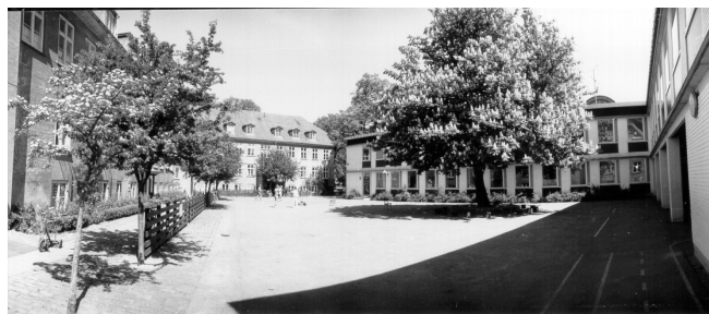
Med den nye bygning fra 1968 fik skolen for første gang egentlige faglokaler og en stor gymnastiksal, der også kan anvendes som teatersal. I 2001-2002 fik bygningen endnu en etage.

Udflytning af elever til elevhjem hjælper kun lidt, men endelig i starten af 1960'erne lysner det.